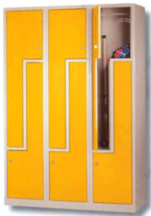
NOV 400 - 2 X 3 PL

La Serie 2PL, se forma a partir de módulos con dos puertas en forma de "L". Este tipo de puerta facilita el guardar objetos o prendas largas en sitios con poco espacio. Las cerraduras se montan en los tramos anchos de las puertas, para aumentar la seguridad.