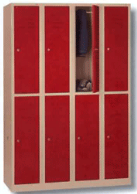
NOV 300 - 2 X 4