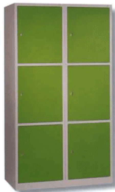
NOV 500 - 3 X 2